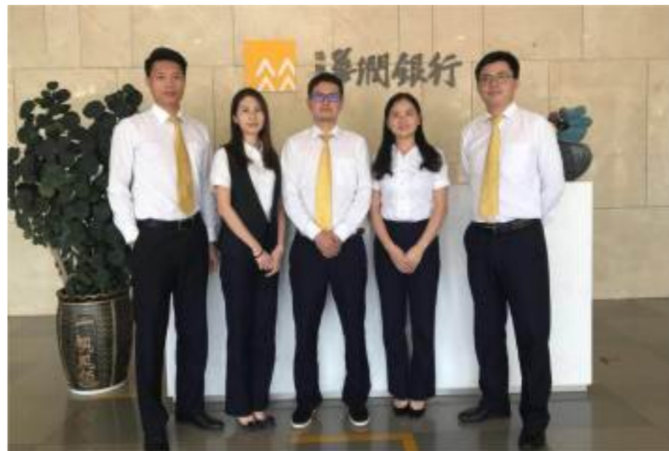
珠海小微金融部业务拓展二部团队

力，而是他们对待彼此的方式。这个团队并不需要都是精英，团队怎样合作要比团队由哪些人组成更重要。而团队合作的关键，在于让每一个人都拥有发言权和自主权，并且是平等的话语权。研究同时指出，心理安全是这个世界上所有高效能的团队共有的特征，心理安全是一种团队共有的信念，即在这个团队里可以大胆地冒险。团队中的成员之间相互尊重、相互信任，大家会在这里表现出真实的自己。