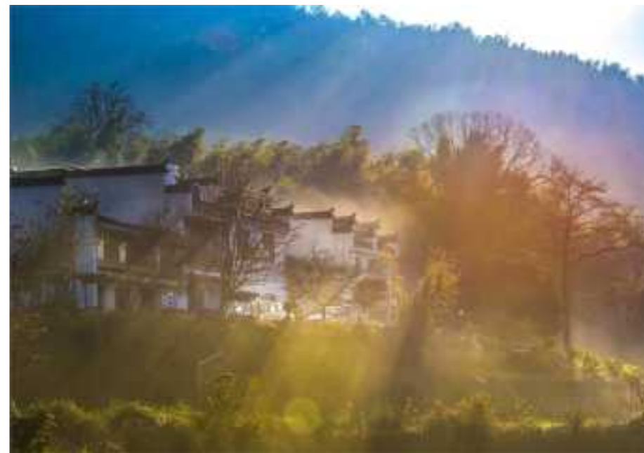
梦想家园 / 广州分行法律合规部 刘海霞