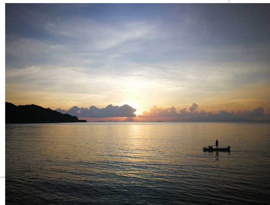
孤舟 / 珠海分行拱北个贷团队 梁庆良