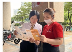
(智能科技部 劉奕繪)

本次網絡安全宣傳周各類活動覆蓋了廣大社會群眾與全行員工，有助進一步提高了網絡安全意識。